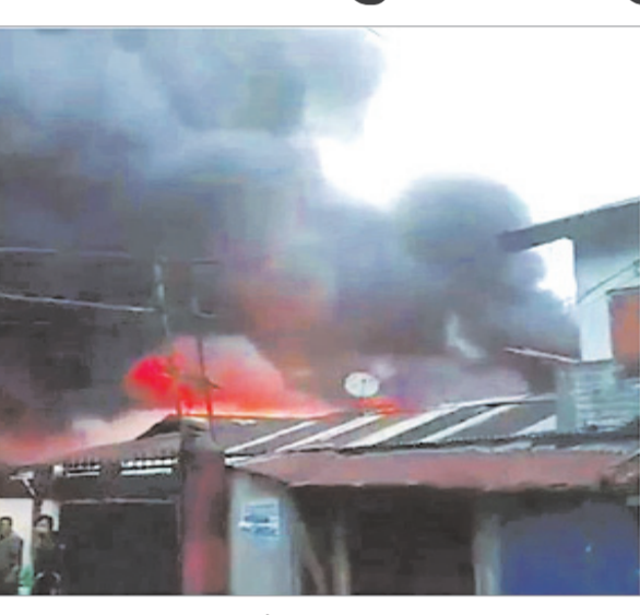
अग्निशमन विभाग ने तत्काल कार्रवाई की, लेकिन दुकान बांस और लकड़ी के बने हुए थे और उनमें सूखा सामान भरा था, इसलिए आग तेजी से फैली। घबराए दुकानदारों ने आग से जो बच सकता था उसे बचाने की कोशिश की लेकिन गैस सिलेंडरों में धमाकों से आग ने विकराल रूप ले लिया। पुलिस ने बताया कि आग को काबू करने के लिए आग बुझाने वाले तीन वाहनों को लगाया गया जिनमें से एक ईटानगर से मंगाया गया था और घंटों की मशकत के बाद आग पर काबू पाया गया।

ईटानगर (एजेंसी)। दिवाली के त्योहार पर जहां देशभर के लोग इस प्रकाश उत्सव को मनाने में व्यस्त थे, वहीं देश के इस सबसे बड़े पर्व के बाद अरुणाचल प्रदेश की राजधानी ईटानगर के नजदीक नाहरलगुन दैनिक बाजार में मंगलवार तड़के लगी आग से कम से कम 700 दुकानें जलकर खाक हो गईं। पुलिस ने बताया कि आग लगने की जानकारी तड़के करीब 4 बजे मिली। पुलिस ने बताया कि यह राज्य का सबसे पुराना बाजार है और अरुणाचल प्रदेश की राजधानी ईटानगर से करीब 14 किलोमीटर दूर नाहरलगुन में अग्निशमन केंद्र के नजदीक स्थित है। पुलिस ने बताया कि संदेह है कि आग दिवाली के उत्सव के दौरान जलाए गए पटाखों या दीयों से लगी। उन्होंने दावा किया कि अग्निशमन विभाग ने तत्काल कार्रवाई की, लेकिन दुकान बांस और लकड़ी के बने हुए थे और उनमें सूखा सामान भरा था, इसलिए आग तेजी से फैली। घबराए दुकानदारों ने आग से जो बच सकता था उसे बचाने की कोशिश की लेकिन गैस सिलेंडरों में धमाकों से आग ने विकराल रूप ले लिया। पुलिस ने बताया कि आग को काबू करने के लिए आग बुझाने वाले तीन वाहनों को लगाया गया जिनमें से एक ईटानगर से मंगाया गया था और घंटों की मशकत के बाद आग पर काबू पाया गया।