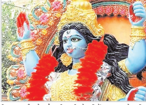
विजय का संदेश देता है, वही काली को पापियों का रूप से उपस्थित थे।