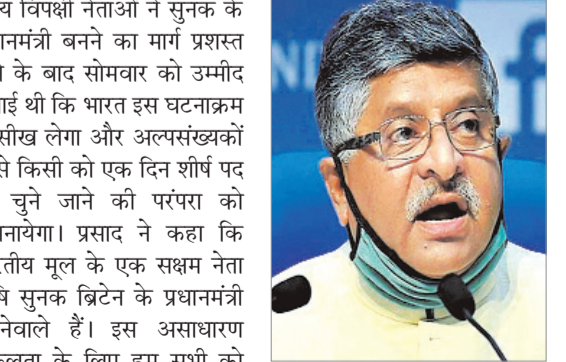
मंजी प्रसाद ने कहा कि सुनक के प्रधानमंत्री पद पर निर्वाचन के बाद कुछ नेता बहुसंख्यकवाद के खिलाफ अति सक्रिय हो गए हैं। उन्होंने कहा कि वह ऐसे नेताओं को एपीजे अब्दुल कलाम के राष्ट्रपति के रूप में असाधारण कार्यकाल और प्रधानमंत्री के रूप में मनमोहन सिंह के 10 वर्षों के कार्यकाल की याद दिलाना चाहेंगे। उन्होंने कहा कि आज एक प्रतिष्ठित आदिवासी नेता देश की राष्ट्रपति हैं। चिदंबरम ने सोमवार को एक ट्वीट में कहा था कि पहले कमला हैरिस और अब ऋषि सुनक। अमेरिका और ब्रिटेन के लोगों ने अपने देशों के गैर-बहुसंख्यक नागरिकों को गले लगाया है और उन्हें सरकार में उच्च पद के लिए चुना है। मुझे लगता है कि भारत और बहुसंख्यकवाद का पालन करनेवाले दलों को एक सबक सीखना चाहिए। थरूर ने कहा था कि अगर ऐसा होता है, तो मुझे लगता है कि हम सभी को यह स्वीकार करना होगा कि एक अल्पसंख्यक को सबसे शक्तिशाली पद पर आसीन कर ब्रिटेनवासियों ने दुनिया में बहुत दुर्लभ काम किया है। हम भारतीय मूल के सुनक की इस उपलब्धि का जश्न मना रहे हैं तो आइए ईमानदारी से पूछें कि क्या यहाँ यह हो सकता है? तृणमूल कांग्रेस की सांसद महुआ मोइजा ने भी सुनक के प्रधानमंत्री चुने जाने का स्वागत किया और भारत के और सहिष्णु बनने की उम्मीद जतायी।

नयी दिल्ली (एजेंसी)। भाजपा ने ब्रिटेन के प्रधानमंत्री चुने गये भारतीय मूल के ऋषि सुनक को एक सक्षम नेता बताया और मंगलवार को कहा कि इस असाधारण सफलता के लिए उनकी सराहना की जानी चाहिए, लेकिन देश के कुछ विपक्षी नेता दुर्भाग्य से इस अवसर पर भी राजनीतिक लाभ उठाने की कोशिश कर रहे हैं। इस अवसर पर भी राजनीतिक लाभ उठाने की कोशिश कर रहे हैं। इस अवसर पर भी राजनीतिक लाभ उठाने की कोशिश कर रहे हैं।