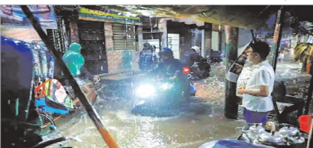
बांग्लादेश में बांग्लादेशी मीडिया ने बताया कि चक्रवात के कारण वहां दक्षिणपूर्वी हिस्सों में भारी बारिश हुई है। आईएमडी ने कहा कि मंगलवार शाम तक इसके कमजोर होकर निम्न दाब क्षेत्र में बदलने का अनुमान है। मौसम कार्यालय ने मंगलवार सुबह पश्चिम बंगाल तट के आसपास 40 से 50 किलोमीटर प्रति घंटे की गति से हवाएं चलने की चेतावनी दी है, जो 60 किलोमीटर प्रति घंटे की रफतार तक पहुंच सकती हैं।

नयी दिल्ली (एजेंसी)। दिवाली की रात चक्रवात सितरंग के तूफान की चपेट में आने से बांग्लादेश में कम से कम सात लोगों की मौत हो गई। समाचार एजेंसी एएफपी ने आफगा मंत्रालय के प्रवक्ता निखिल सरकार के हवाले से बताया कि बरगुना, नारेल, सिराजगंज और द्वीपीय जिले भोला से मौतों की सूचना मिली है। वहीं, कॉक्स बाजार तट से हजारों की संख्या में लोगों और मवेशियों को सुरक्षित स्थान ले जाया गया है। चक्रवात सितरंग पश्चिम बंगाल तट को पार करते हुए बरिसाल के निकट अब बांग्लादेश तट से टकराया है। भारत मौसम विज्ञान विभाग ने कहा कि दक्षिणी पश्चिम बंगाल के जिलों में मौसम में पूर्वाह्न से सुधार होने की संभावना है। 156 किलोमीटर प्रति घंटे की गति से बंगाल की उत्तरी खाड़ी से बांग्लादेश की ओर बढ़ी इस मौसम प्रणाली के कारण पश्चिम बंगाल के तटीय जिलों दक्षिण 24 परगना, उत्तर 24 परगना और पूर्वी मेदिनीपुर में मध्यम से भारी बारिश स्तर की बारिश हुई और मौसम खराब हुआ, जिसने दीपावली और काली पूजा उल्लास को कम कर दिया। कोलकाता में क्षेत्रीय मौसम केंद्र ने कहा कि सितरंग ने सोमवार को रात साढ़े नौ बजे से साढ़े 11 बजे के बीच बांग्लादेश में बारिसल के पास तिनकोना द्वीप और सैंडविच के बीच 80 से 90 किलोमीटर प्रति घंटे की रफतार से 100 किलोमीटर प्रति घंटे की रफतार से तट पर टकराया। बांग्लादेशी मीडिया ने बताया कि चक्रवात के कारण वहां दक्षिणपूर्वी हिस्सों में भारी बारिश हुई है। आईएमडी ने कहा कि मंगलवार शाम तक इसके कमजोर होकर निम्न दाब क्षेत्र में बदलने का अनुमान है। मौसम कार्यालय ने मंगलवार सुबह पश्चिम बंगाल तट के आसपास 40 से 50 किलोमीटर प्रति घंटे की गति से हवाएं चलने की चेतावनी दी है, जो 60 किलोमीटर प्रति घंटे की रफतार तक पहुंच सकती हैं।