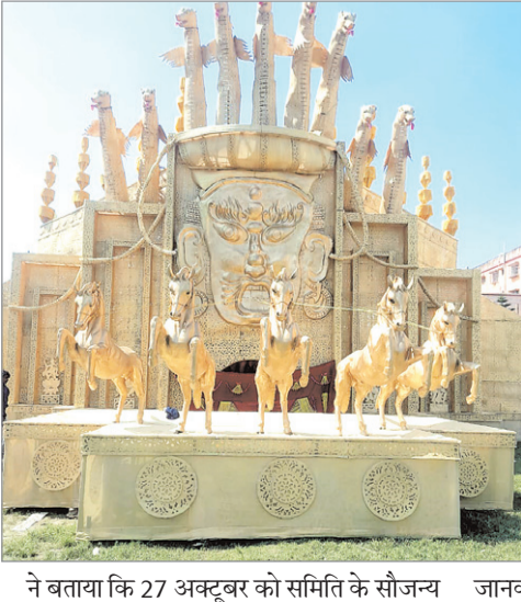
ने बताया कि 27 अक्टूबर को समिति के सौजन्य