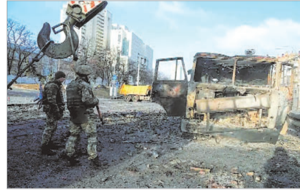
स्वीकृत दिखाता है। खेरसांन से रूसी सेना की वापसी पर भी उन्होंने इशारा किया है। विशेषज्ञ मान रहे हैं कि रूसी सेना पीछे नहीं हट रही, बल्कि संभव है कि वे हवाई हमलों को एक बार फिर शुरूआत करें।

यूक्रेनी सेना दक्षिणी क्षेत्र खेरसांन में भयानक तरीके से जवाबी हमला कर रही है। सुरोविकिन ने माना कि इस इलाके में स्थिति अच्छी नहीं है। उन्होंने आगे कहा, 'खेरसांन शहर के बारे में आगे की कार्रवाई और योजनाएं विकासशील सैन्य-सामरिक स्थिति पर निर्भर करेंगी, जो आसान नहीं है।' सुरोविकिन का ये बयान रूसी सेना के सामने आने वाली कठिनाइयों की