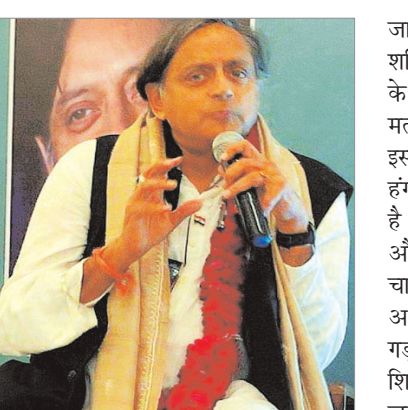
मुकाबला करने के लिए उनका उपहास किया जायेगा और उन्हें शर्मिदा किया

नयी दिल्ली (एजेंसी)। भारतीय जनता पार्टी (भाजपा) ने कांग्रेस अध्यक्ष के चुनाव में पराजित हुए शशि थरूर को आड़े हाथों लेते हुए उन्हें चेताया कि आनेवाले दिनों में उन्हें गांधी परिवार की मुखालफत करने के लिए शर्मिदा किया जायेगा। भाजपा के आईटी प्रकोष्ठ के प्रभारी अभित मालवीय ने एक ट्वीट में कहा कि शशि थरूर एक हारे हुए व्यक्ति की तरह रो रहे हैं। क्या उन्हें वास्तव में कांग्रेस में चुनाव स्वतंत्र और निष्पक्ष होने की उम्मीद थी? उसे आभारी होना चाहिए कि उसे बाथरूम में बंद नहीं किया गया था... सबसे बुरा अभी आना बाकी है। अगले कुछ महीनों में गांधी परिवार से