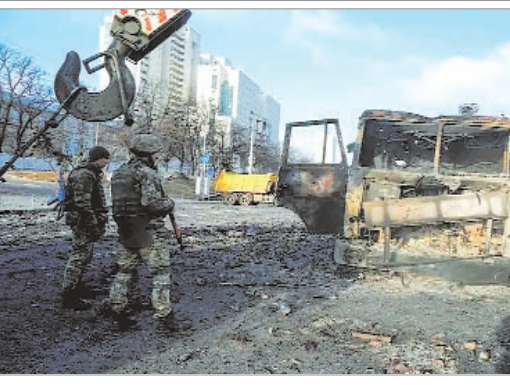
स्वीकृत दिखाता है। खेरसांन से रूसी सेना की वापसी पर भी उन्होंने इशारा किया है। विशेषज्ञ मान रहे हैं कि रूसी सेना पीछे नहीं हट रही, बल्कि संभव है कि वे हवाई हमलों की एक बार फिर शुरुआत करें।

यूक्रेनी सेना दक्षिणी क्षेत्र खेरसांन में भयानक तरीके से जवाबी हमला कर रही है। सुरोविकिन ने माना कि इस इलाके में स्थिति अच्छी नहीं है। उन्होंने आगे कहा, 'खेरसांन शहर के बारे में आगे की कार्रवाई और योजनाएं विकासशील सैन्य-सामरिक स्थिति पर निर्भर करेंगी, जो आसान नहीं है।' सुरोविकिन का ये बयान रूसी सेना के सामने आने वाली कठिनाइयों की