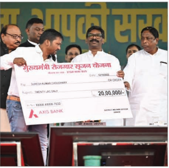
● मुख्यमंत्री रोजगार सृजन योजना का लासुक।

झारखण्ड/ गिरिडीह मुझे मिनी बस के लिए मुख्यमंत्री रोजगार सृजन योजना के तहत 20 लाख रुपये का चेक मिला है। मेरे द्वारा दिए गए आवेदन पर बहुत ही कम समय में लोन की स्वीकृति मिल गयी। मुझे बार-बार कार्यालय जाने की जरूरत भी नहीं पड़ी। इससे पहले तक मैं अपने भविष्य को लेकर चिंतित था, लेकिन अब मुझे इस योजना का लाभ मिला है। सरकार का आभार। अब मैं स्वरोजगार के जरिये अन्य लोगों को भी रोजगार उपलब्ध कराने का प्रयास करूंगा। राज्य के मेरे जैसे बेरोजगार युवाओं को इस योजना का लाभ उठा कर स्वरोजगार अपनाया चाहिए। यह योजना व्यवसाय करने वाले युवाओं के लिए बहुत लाभदायक है।