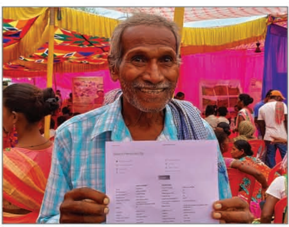
● सर्वजन पेंशन योजना से आच्छादि हुए बुजुर्ग।

झारखण्ड/ चाईबासा सर्वजन पेंशन योजना से राज्य के लाखों बुजुर्ग, निराश्रित महिला और दिव्यांग आदि को पेंशन का लाभ मिल रहा है। चाईबासा प्रखंड अंतर्गत बादरी के अरधन कुदादा बताते हैं कि वह 65 साल के हैं तथा पेंशन लेने के लिए उन्होंने कई बार प्रयास किया, लेकिन कभी पेंशन का लाभ नहीं मिला। वह कहते हैं कि मैं सीएम हेमन्त सोरेन जी को बहुत बधाई और आशीर्वाद देता हूँ कि वह हम जैसे बुजुर्गों का ध्यान रखते हुए गांव में आपकी योजना आपकी सरकार आपके द्वार कार्यक्रम का आयोजन करा रहे हैं। आज अपने ही गांव में लगे शिविर में आने के बाद यहां उपस्थित कर्मियों के द्वारा मुझे योजना की जानकारी