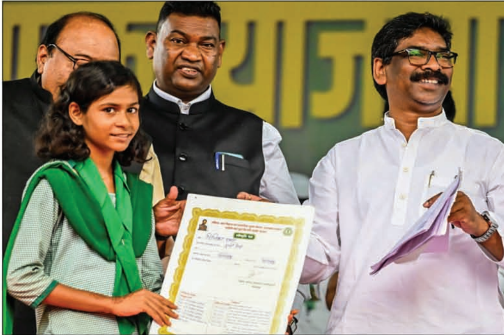
● गिरिडीह में सावित्रीबाई फुले किशोरी समृद्धि योजना का स्वीकृति पत्र प्राप्त करती किशोरी।

से जोड़ रही है। अभी तक 80 हजार से अधिक किशोरियों को इस योजना का लाभ मिला है। देश की पहली महिला शिक्षिका सावित्रीबाई फुले के नाम से संचालित इस योजना के जरिये किशोरियों को कक्षा 8वीं में 2,500 रुपये, कक्षा 9वीं में 2,500 रुपये, कक्षा 10वीं में 5,000 रुपये, कक्षा 11वीं में 5,000 रुपये, कक्षा 12वीं में 5,000 रुपये एवं 18-19 वर्ष की आयु की किशोरियों को एकमुश्त 20,000 रुपये सहायता राशि प्रदान की जा रही है। इस पूरी अवधि में कुल 40,000 रुपये की आर्थिक सहायता किशोरियों को मिलेगी। इससे उन्हें आगे पढ़ने में सहयोग मिलेगा और ड्राप आउट रेट भी घटेगा। मुख्यमंत्री हेमन्त सोरेन द्वारा बीते दिनों आपकी योजना आपकी सरकार आपके द्वार कार्यक्रम को लेकर स्पष्ट निर्देश दिया गया है कि सावित्रीबाई फुले किशोरी समृद्धि योजना के अंतर्गत योग्य लक्ष्मियों से आवेदन लेकर जांच के बाद योजना का लाभ दें। इस योजना के साथ-साथ अन्य कई लोक-कल्याणकारी योजनाओं से जोड़ने हेतु शिविर का आयोजन किया जा रहा है, जिससे शत-प्रतिशत लक्ष्मियों को योजनाओं से जोड़ा जा सके।