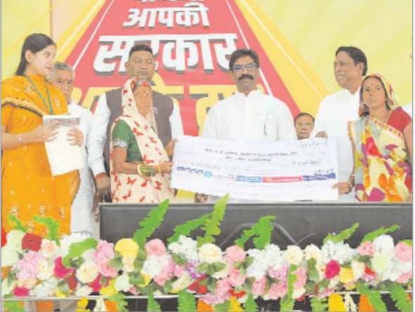
आपके द्वार कार्यक्रम को संबोधित कर रहे थे। मौके पर मुख्यमंत्री ने कोडरमा जिला प्रशासन की ओर से सावित्रीबाई फुले किशोरी

नवीन मेल संवाददाता कोडरमा। पहले बंद कमरों में योजनाएं बनती थीं और वहीं समाप्त हो जाती थीं। लोगों को इन योजनाओं का लाभ मिलना तो दूर जानकारी तक नहीं होती थी। लेकिन, हमारी सरकार में अधिकारी तमाम योजनाओं को लेकर आपके दरवाजे पर जा रहे हैं। हमारा आग्रह है कि आप इन योजनाओं को अपने घर ले जायें और अपनी आय बढ़ाकर सशक्त, समृद्ध और स्वावलंबी बनें। मुख्यमंत्री हेमंत सोरेन मंगलवार को कोडरमा में आयोजित आपकी योजना-आपकी सरकार-