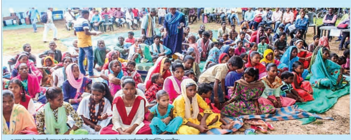
● बूढ़ा पहाड़ के खपरी महुआ गांव में आयोजित सरकार आपके द्वार कार्यक्रम में उपस्थित ग्रामीण।

हैं। शिविर में आते ही उससे तुरंत आवेदन प्राप्त कर मेडिकल टीम ने सभी आवश्यक कार्रवाई पूरी करते हुए दिव्यांग पेंशन स्वीकृत की।