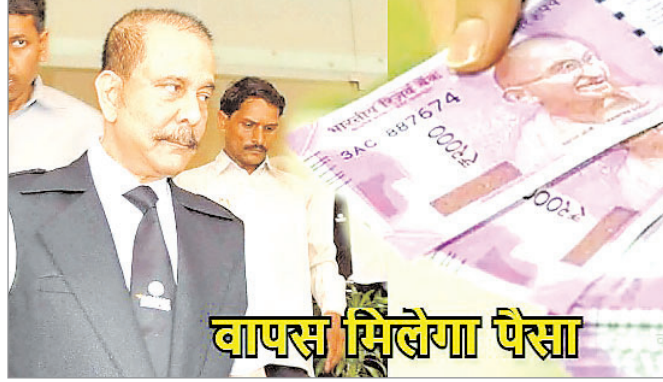
वापस मिलेगा पैसा

नवीन जेल संवाददाता रांची। झारखंड के ढाई लाख से भी ज्यादा लोगों के तीन हजार करोड़ रुपये सहारा इंडिया की विभिन्न योजनाओं में फंस गए हैं। जमा योजनाओं की पॉलिसी परिपक्व होने के बाद भी लगभग दो वर्ष से भुगतान पूरी तरह बंद है। राज्य के अलग-अलग इलाकों में स्थित सहारा के दफ्तरों में हर रोज बड़ी तादाद में पॉलिसी की राशि के भुगतान की मांग लेकर पहुंच रहे हैं लेकिन उन्हें मायूस होकर लौटना पड़ रहा है। रांची, हजारीबाग, रामगढ़, बेरमो, बोकारो, धनबाद, जमशेदपुर सहित कई जिलों में निवेश करने वाले लोगों ने सहारा के दफ्तरों के बाहर प्रदर्शन भी किया है। इन शाखाओं के प्रबंधकों और कर्मियों के पास कोई जवाब नहीं है। कंपनी के लिए काम करने वाले 60 हजार से भी ज्यादा कर्मी भी हर रोज हो रहे हंगामे से परेशान हैं। निवेशकों का कहना है मैच्योरिटी की राशि का भुगतान न होने से किसी का इलाज के अभाव में निधन हो गया तो किसी के बच्चों की पढ़ाई से