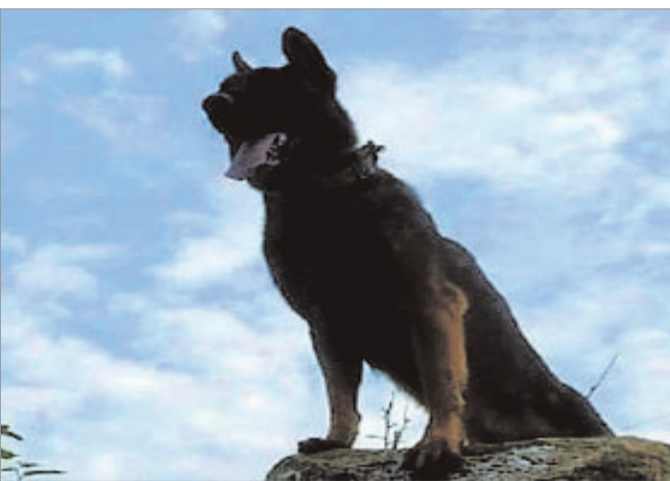
सैनिक ने अपना काम जारी रखा जिसके चलते हम दो आतंकवादियों को मार सके।