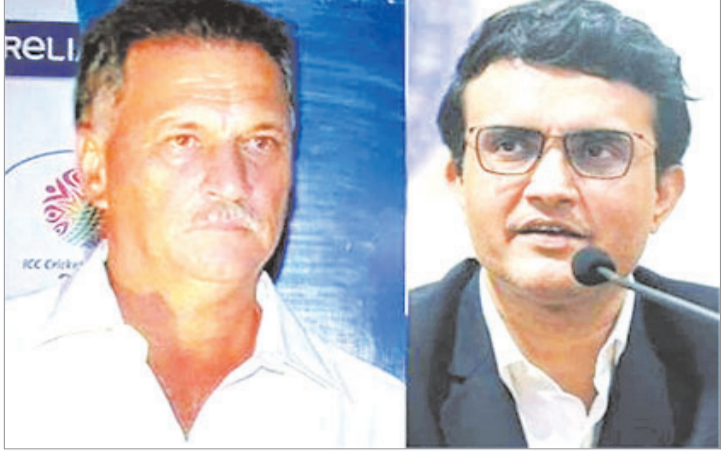
मंजूरी पर बीसीसीआई से जुड़े संचिधान में संशोधन भी किया गया है। इसके मुताबिक, गांगुली और जय शाह दोनों चाहें तो कार्यकाल 2025 तक जारी रख सकते हैं।

बीसीसीआई अध्यक्ष पद पर गांगुली 2025 तक रह सकते हैं, लेकिन वह बनना चाहते हैं आईसीसी अध्यक्ष