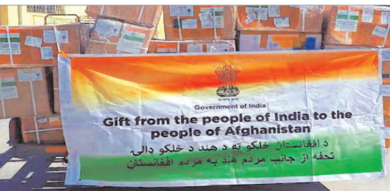
तेपेदिक निरोधक सामग्री शामिल है। इसके अलावा 40 हजार टन गेहूं की भी आपूर्ति की गयी है।

नयी दिल्ली (एजेंसी)। भारत ने अफगानिस्तान के लोगों को आवश्यक दवाओं एवं चिकित्सीय उपकरणों की 13वीं खेप मंगलवार को काबुल पहुंचायी है। विदेश मंत्रालय ने यहां बताया कि अफगानिस्तान के लोगों के साथ विशेष संबंधों को ध्यान में रखते हुए उनकी तात्कालिक जरूरतों के अनुरूप आवश्यक दवाओं एवं चिकित्सीय सामग्री की 13वीं खेप भेजी है। भारतीय अधिकारियों ने काबुल के इंदिरा गांधी बाल चिकित्सालय को यह सामग्री सौंपी। इस सामग्री में पीडियाट्रिक स्टेथोस्कोप, स्फाइमोमैमैनीमीटर मोबाइल टाइप एवं पीडियाट्रिक बीपी कफ, ड्रिप चैंबर सेट, इलैक्ट्रो कार्टी नाइलॉन सूचक आदि शामिल हैं। भारत ने अफगानिस्तान के लोगों के लिए अब तक 45 टन चिकित्सीय सहायता की आपूर्ति की है जिनमें पांच लाख खुराक कोविड के टीके,