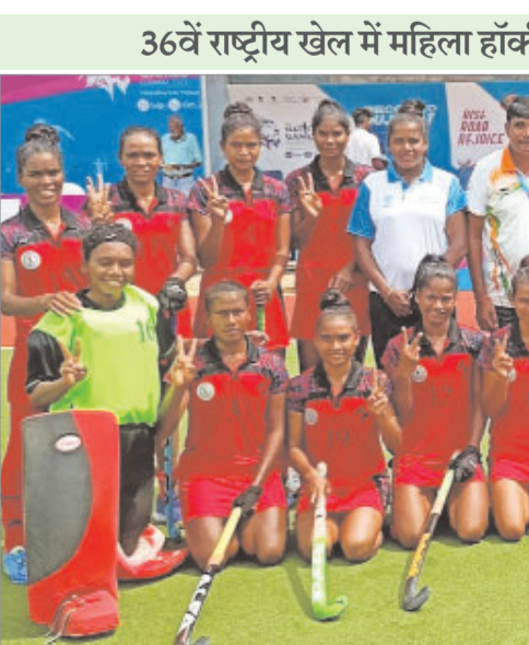
36वें राष्ट्रीय खेल में महिला हॉकी झारखंड टीम का शानदार प्रदर्शन

सतर्क हो गये और यूपी टीम के खिलाड़ियों की एक नहीं चलने दी और मैच 6-1 से जीत दर्ज करते हुए सेमीफाइनल में जगह बना ली।