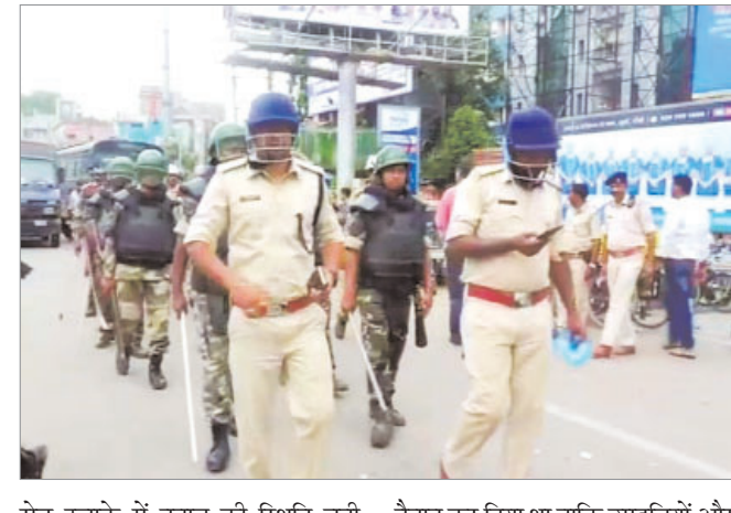
रोड इलाके में तनाव की स्थिति बनी हुई है। हालांकि, पुलिस ने एहतियातन सुबह से ही मेन रोड में पुलिस बल को तैनात कर दिया था ताकि उपद्रवियों और असामाजिक तत्वों के बीच यह संदेश जाये कि पुलिस पूरी तरह से अलर्ट है।

रांची। राजधानी में माहौल को खराब करने की लगातार कोशिश की जा रही है। ऐसे में पुलिस एक तरफ जहां सोशल मीडिया पर नजर रखे हुए है, वहीं दूसरी ओर तनाव वाले इलाके में फ्लैग मार्च कर लोगों के बीच यह संदेश दे रही है कि राजधानी में सब कुछ ठीक है और पुलिस हर जगह मुस्तैद है। रांची के मेन रोड इलाके में स्थित हनुमान मंदिर में तोड़फोड़ के बाद मामले को तूल देने की पूरी कोशिश की जा रही है। एक तरफ जहां पुलिस मामले को संभालने में लगी है, वहीं तरफ कुछ लोग हनुमान प्रतिमा को विखंडित किये जाने के मामले को लेकर लगातार विरोध कर रहे हैं। ऐसे में रांची के मेन