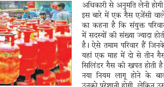
अधिकारी से अनुमति लेनी होगी। इस बारे में एक गैस एजेंसी वाले का कहना है कि संयुक्त परिवार में सदस्यों की संख्या ज्यादा होती है। ऐसे तमाम परिवार हैं जिनके यहां एक माह में दो से तीन गैस सिलेंडर गैस की खपत होती है। नया नियम लागू होने के बाद उनको परेशानी होगी, लेकिन उस परिवार के अन्य प्रमुख परिवार व सदस्यों के नाम से गैस सिलेंडर का रजिस्ट्रेशन कराकर जरूरत के मुताबिक उनके नाम से हर माह गैस सिलेंडर रिफिल की बुकिंग कराके खपत की पूरी की जा सकती है।

है। अब घरेलू गैस ग्राहक एक वर्ष में केवल 15 बार ही गैस सिलेंडर को रिफिल करा सकेंगे और एक माह में दो से ज्यादा गैस सिलेंडर नहीं ले सकेंगे। इस नये फरमान के बाद उन घरों की परेशानी बढ़ने वाली है, जहां परिवार बड़ा है, लोग ज्यादा हैं या संयुक्त परिवार हैं और एक वर्ष में 15 से ज्यादा