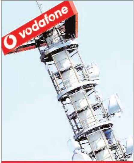
66 प्रतिशत की गिरावट के साथ 477 करोड़ रुपये पर आ गया। वहीं कंपनी के मुताबिक उसे इस अवधि में करीब 6200 करोड़ रुपये मिलने थे लेकिन वो प्राप्त

नई दिल्ली (एजेंसी)। वोडाफोन आइडिया को कनेक्टिविटी को लेकर कई तरह की मुश्किलें खड़ी हो सकती हैं। दरअसल टावर सेवाएं देने वाली कंपनी इंडस टावर ने कड़े शब्दों में वोडाफोन आइडिया को चेतावनी दी है कि अगर कंपनी ने उसके बकाया बिल का जल्द भुगतान नहीं किया तो वो नवंबर से उनके टावर का इस्तेमाल करने से रोक सकता है। अगर ऐसा होता है तो वोडाफोन आइडिया के ग्राहकों को नवंबर से कनेक्टिविटी नहीं मिल पाएगी, यानि मोबाइल कॉल से लेकर इंटरनेट तक की सेवाओं का वो इस्तेमाल नहीं कर सकेगे। फिलहाल वोडाफोन पर टावर कंपनियों का 10 हजार करोड़ रुपये का बकाया है जिसमें से इंडस टावर का हिस्सा 7 हजार करोड़ रुपये का है। इंडस टावर ने कड़े शब्दों में वोडाफोन आइडिया से बकाया चुकाने को कहा है। दरअसल कंपनी की बोर्ड बैठक में बढ़ते हुए बकाया पर चिंता जताई गई थी और पता चला था कि इसमें सबसे बड़ा हिस्सा वोडाफोन आइडिया का है। जिसके बाद इंडस टावर ने वोडाफोन आइडिया को अक्टूबर तक पूरा बकाया चुकाने को कहा है। जून तिमाही नतीजों में इंडस टावर का मुनाफा