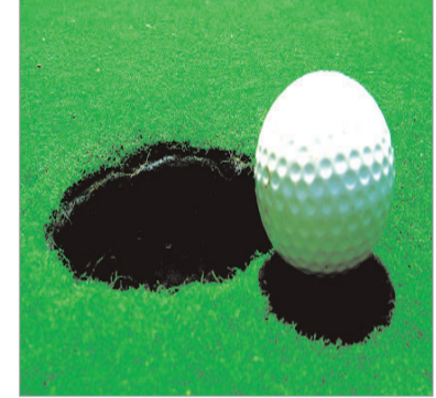
अकादमी के उद्घाटन के अवसर पर जम्मू में पीजीटीआई स्तर के टूर्नामेंट की मेजबानी की