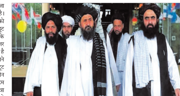
अधिकारियों को इसमें छूट देने के पक्ष में हैं। संयुक्त राष्ट्र सुरक्षा परिषद इस बात पर मतदान

काबुल (एजेंसी)। अफगानिस्तान पर कब्जा कर चुका तालिबान और बेखौफ हो गया है। अब उसने संयुक्त राष्ट्र सुरक्षा परिषद को धमकी दी है। तालिबान ने यात्रा प्रतिबंध छूट के संबंध में संयुक्त राष्ट्र सुरक्षा परिषद के सदस्य देशों के बीच असहमति के मद्देनजर चेतावनी है। तालिबानी अधिकारियों ने कहा है कि यदि परिषद ने यात्रा प्रतिबंध छूट को बढ़ाने से इनकार किया तो उनके धैर्य का बांध टूट सकता है। संयुक्त राष्ट्र सुरक्षा परिषद के तीन स्थायी सदस्य अमेरिका, यूनाइटेड किंगडम और फ्रांस तालिबान अधिकारियों पर यात्रा प्रतिबंध लगाना चाहते हैं। परिषद के अन्य दो स्थायी सदस्य रूस और चीन 13 तालिबान